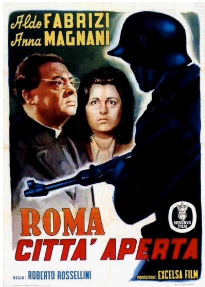
Cartell de Roma, ciutat oberta (1945), de Roberto Rossellini.

Observeu atentament el cartell següent de la pel·lícula Roma, ciutat oberta (1945), de Roberto Rossellini, i responeu a les qüestions 2.1, 2.2 i 2.3.