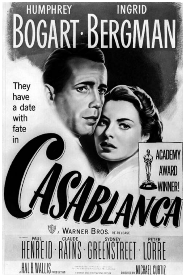
Cartell de Casablanca (1942), de Michael Curtiz.

Observeu atentament el cartell següent de la pel·lícula Casablanca (1942), de Michael Curtiz, i responeu a les qüestions 2.1, 2.2 i 2.3.