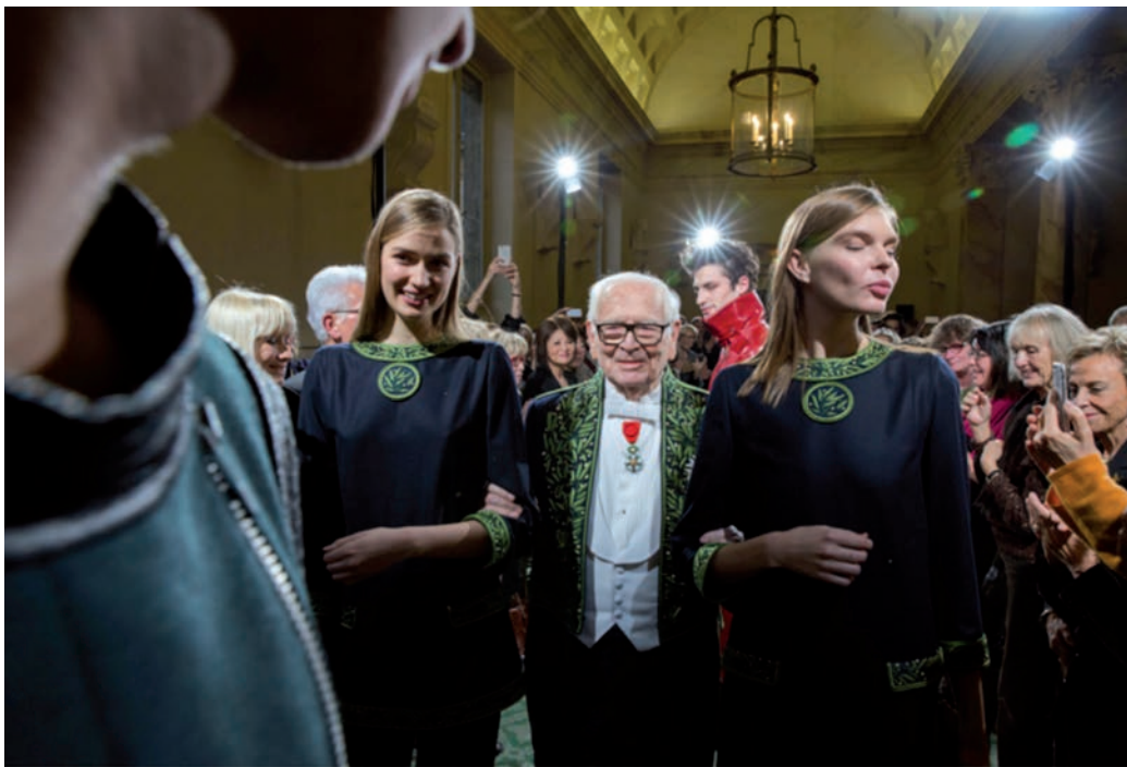
Fotografia feta durant la celebració del 70è aniversari de la carrera de Pierre Cardin, a l'Académie des Beaux-Arts de París. Bruno Barbey, 2016.

Observeu atentament la fotografia següent, obra del fotògraf Bruno Barbey, i responeu a les qüestions 2.1, 2.2 i 2.3.