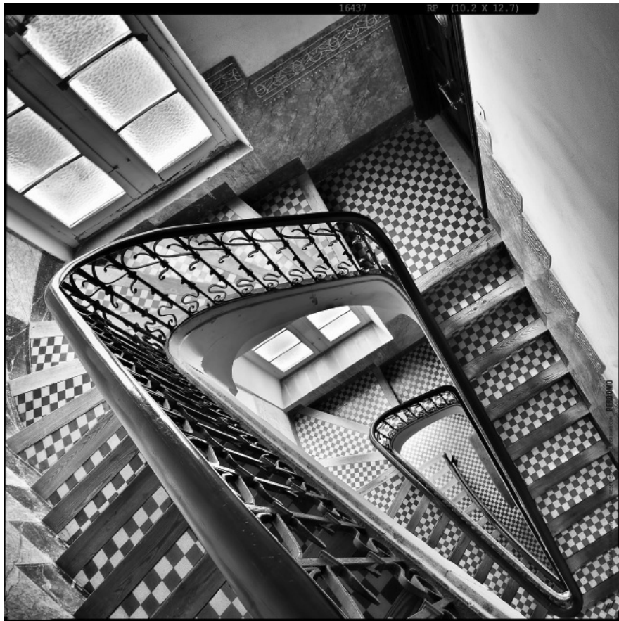
Relativitat , Rubén García Perdomo, 2012

Observeu atentament la imatge següent, del fotògraf tarragoní Rubén García Perdomo, i responeu a les qüestions 2.1 i 2.2.