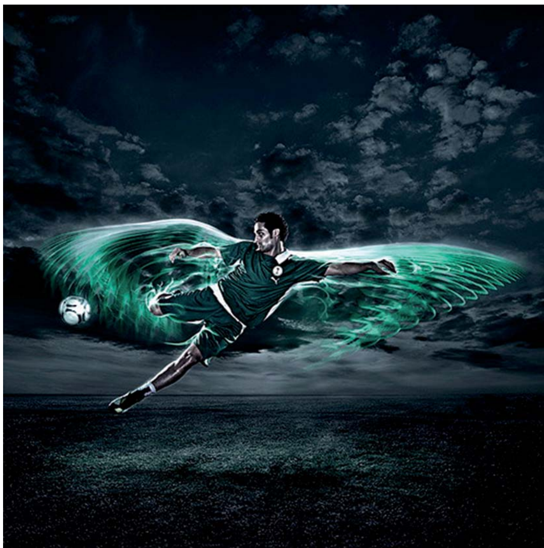
Cameroon football selection, Andy Green, 2010.

Observeu atentament la imatge següent i responeu als apartats 2.1 i 2.2.