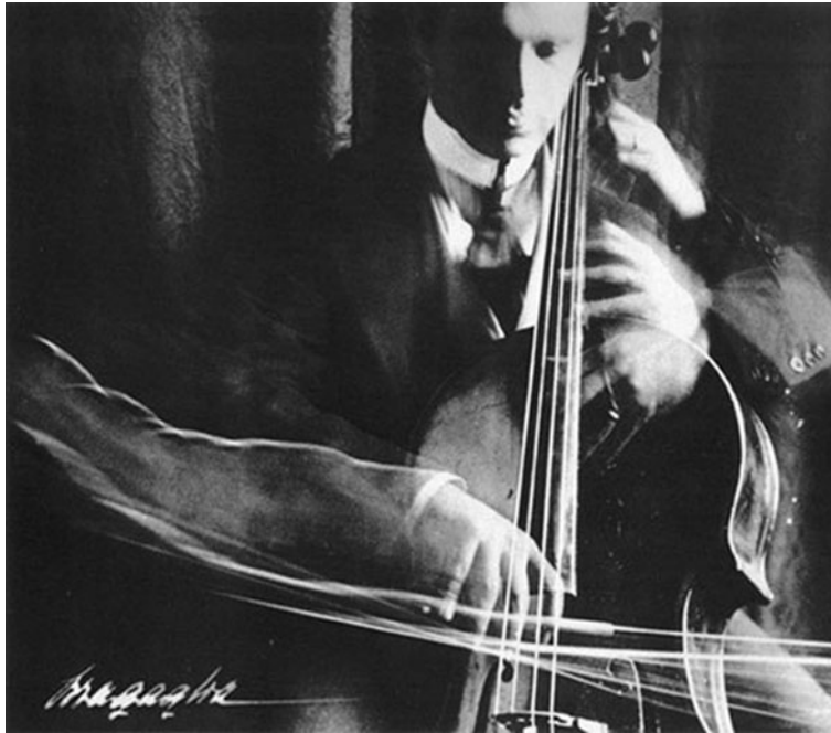
El violoncel·lista , A. G. Bragaglia, 1913.

Observeu atentament aquesta imatge, obra del fotògraf Anton Giulio Bragaglia, i responeu als apartats 2.1 i 2.2.