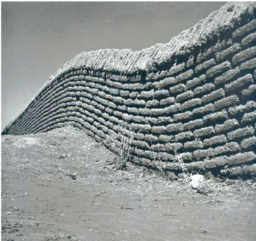
Barda tirada en un campo verde , Juan Rulfo, 1948.

Observeu atentament la fotografia següent, obra de Juan Rulfo, i responeu als apartats 2.1 i 2.2.