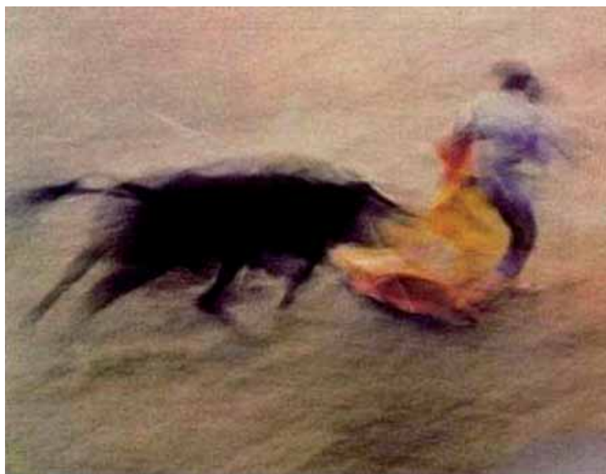
FOTOGRAFIA B. Bullfight , Ernst Haas, 1956.